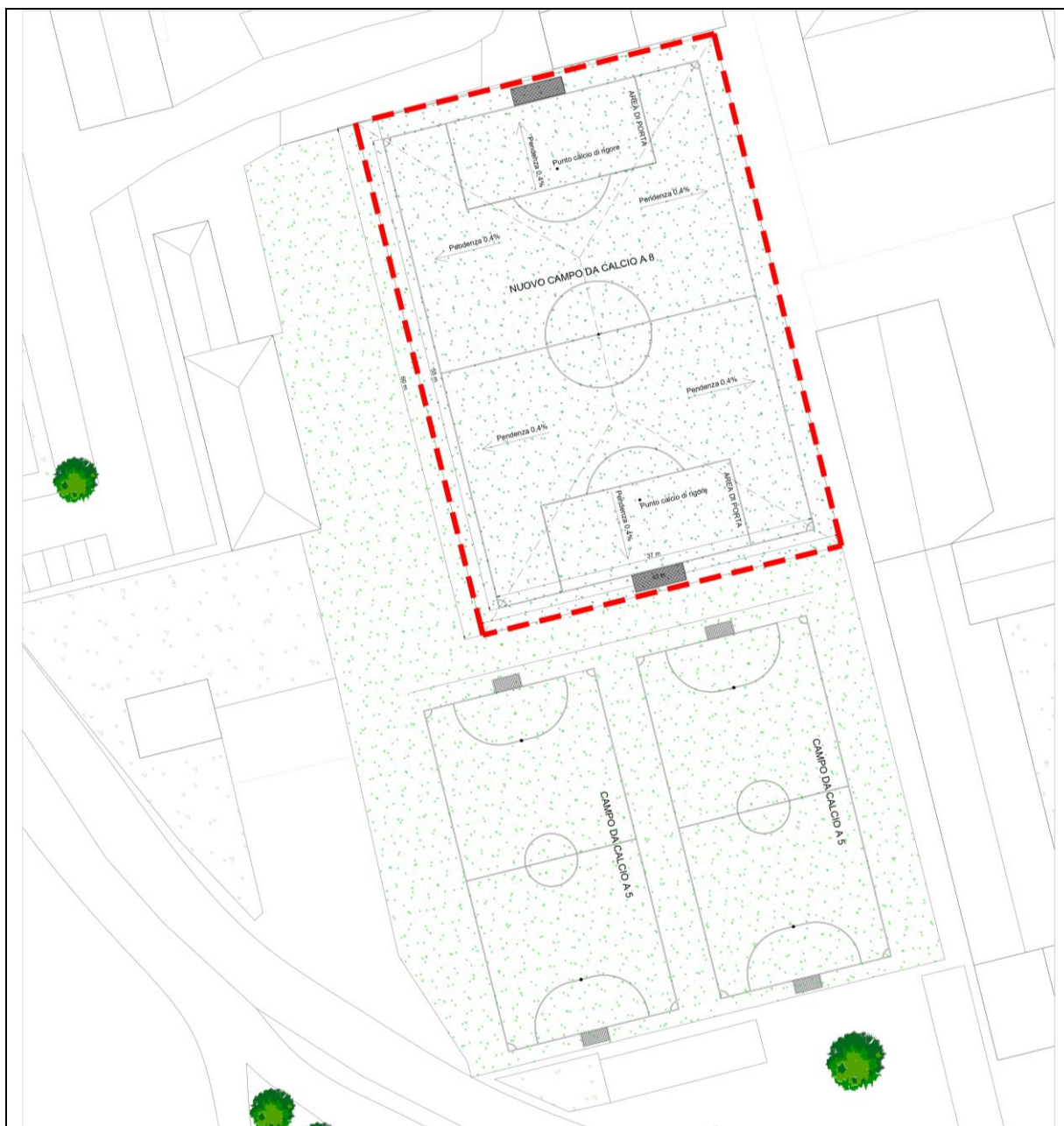
Planimetria di progetto campo calcio a 8

CAPITOLATO SPECIALE D'APPALTO - PROGETTO ESECUTIVO